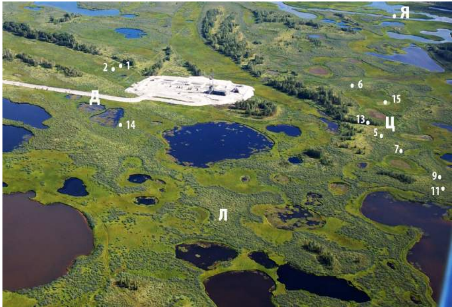
Рис. 1. Вид на Ягмуньягунский ключевой полигон с борта самолета (10.09.2003 г.,). Номера точек соответствуют полевым номерам описаний, приведенным в текстовой характеристике полигона и в таблице. Прочие обозначения: Д – насыпная дорога к песчаной отсыпке (промышленному объекту); Л – крупный контур одного из лопарскоивняков; Ц – центр ключевого полигона, Я – русло р. Ягмуньягун

Ягмуньягунский ключевой полигон представляет собой выровненное пространство с небольшими перепадами высот. Поверхности среднего высотного уровня заняты сообществами ивы лопарской, более низкие – болотистыми лугами и травяными болотами (рис. 1). Наиболее обычные доминанты лугово-болотной растительности – Calamagrostis purpurea , Carex acuta , Carex aquatilis , Comarum palustre , Carex vesicaria .